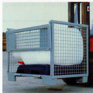
Einfaches Handling durch gute Unterfahrbarkeit